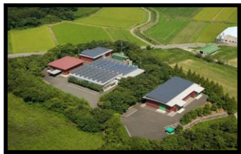
自然との共存を目指す超精密加工工場

各設備は担当者が毎日点検を行っています。 設備講習毎に標準書を作成し、作業の統一を試みています。